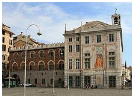
Il prospetto settentrionale visto da piazza Caricamento

Su via della Mercanzia si affaccia l'ala cinquecentesca, con la facciata interamente ricoperta dagli affreschi di Raimondo Sirotti che ricalcano quelli realizzati all'inizio del Novecento da Ludovico Pogliaghi, che a sua volta aveva rifatto, reinterprestandoli, quelli originali del Tavarone